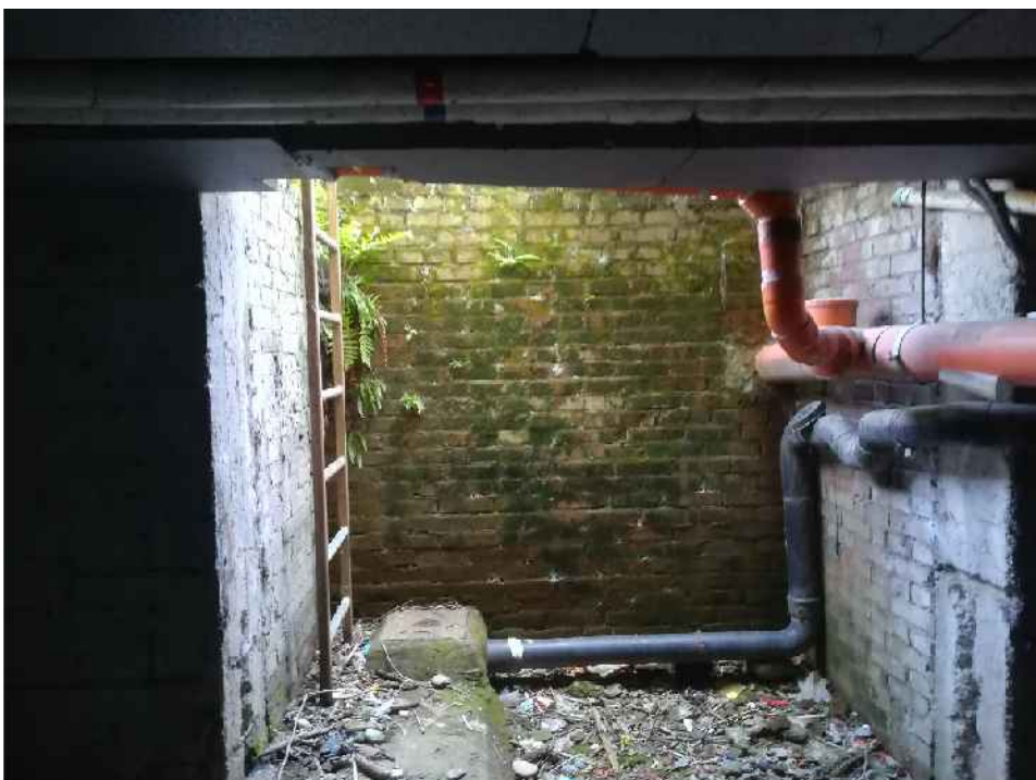
Foto Giunto tipo 5cm